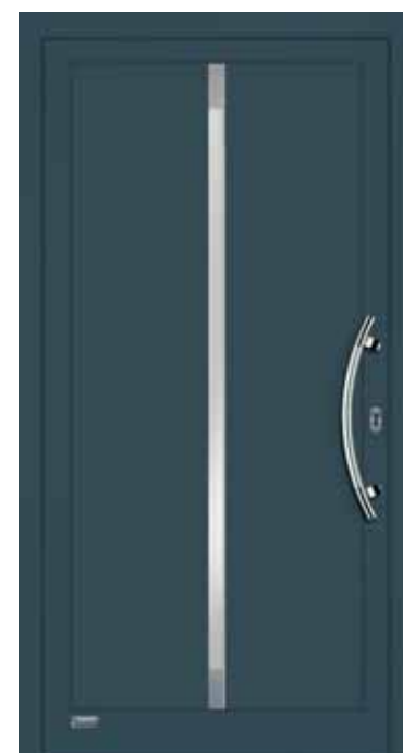
Haustürmodell „VIONA-Lisene 105“, Glas VSG matt