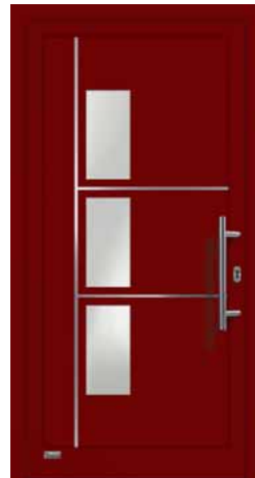
Haustürmodell „VIONA-Lisene 109“, Glas VSG matt