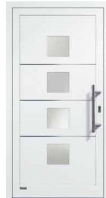
Haustürmodell „VIONA-Lisene 103“, Glas VSG matt