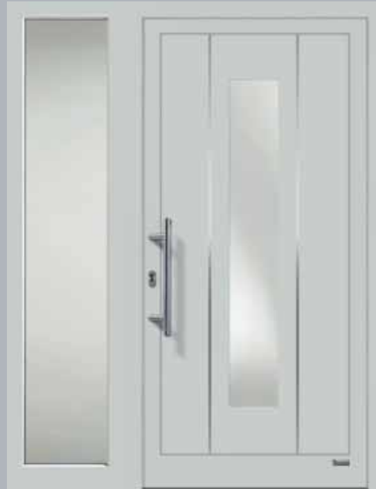
Haustürmodell „VIONA-Lisene 110“, Glas VSG matt

Haustüren sind statistisch gesehen die Bauteile, die am längsten im Baukörper verbleiben. Umso wichtiger ist es, dass Ihre Haustür nicht nur besonders langlebig ist, sondern auch genau Ihrem Geschmack entspricht.