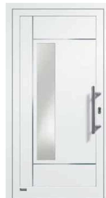
Haustürmodell „VIONA-Lisene 108“, Glas VSG matt