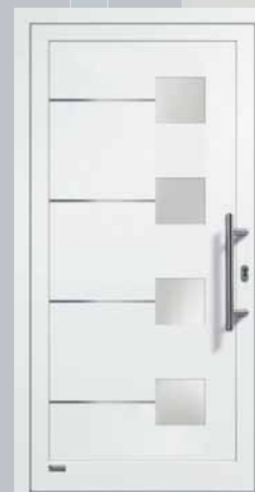
Haustürmodell VIONA-Lisene 106“, Glas VSG matt