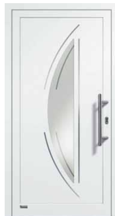
Haustürmodell „VIONA-Lisene 107“, Designglas Nr. 12 und VSG