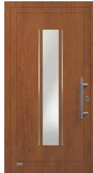
Haustürmodell „VIONA-Lisene 104“, Glas VSG matt