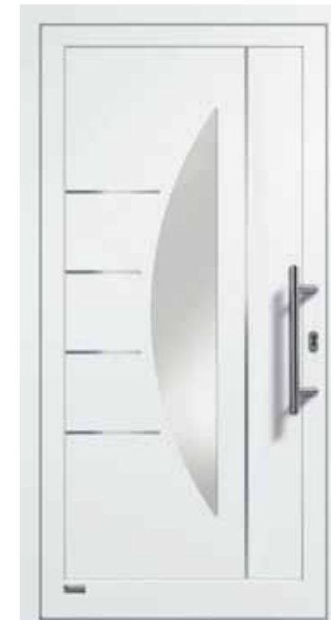
Haustürmodell „VIONA-Lisene 111“, Glas VSG matt