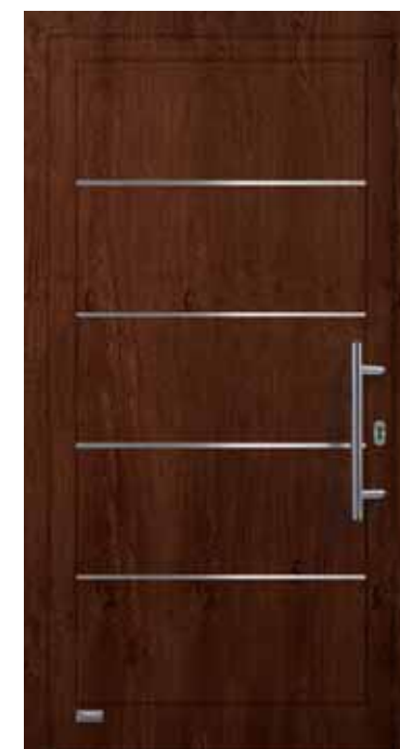
Haustürmodell „VIONA-Lisene 102“, Glas VSG matt