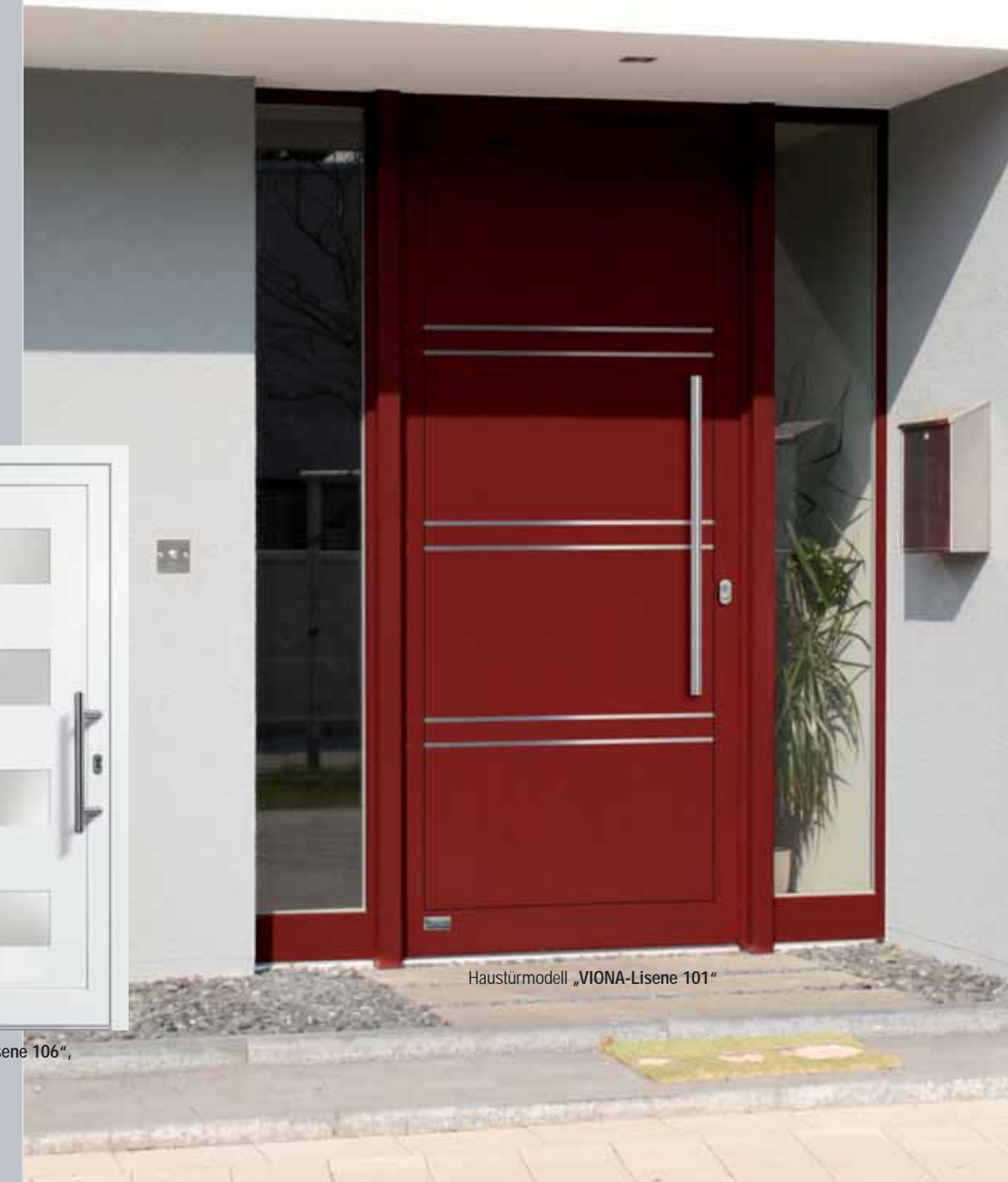
Haustürmodell „VIONA-Lisene 101“