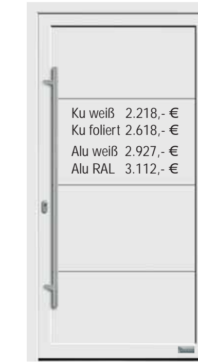
Haustürmodell „7703-92“, mit Nuten mit Griffstange in Edelstahl, Länge: 1400 mm