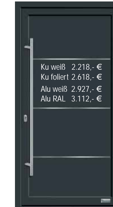
Modell „7730-94“, mit Griffstange in Edelstahl, Länge: 1400 mm, Lisenen auf der Außenseite