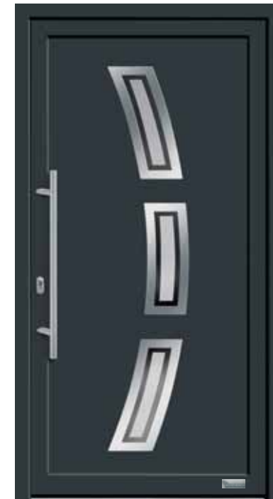
Haustürmodell „7748-70“, mit Griffstange in Edelstahl, Länge: 800 mm, Glas „G500-25“ MP: Orn.-Rahmen Edelstahloptik außen 169,-€