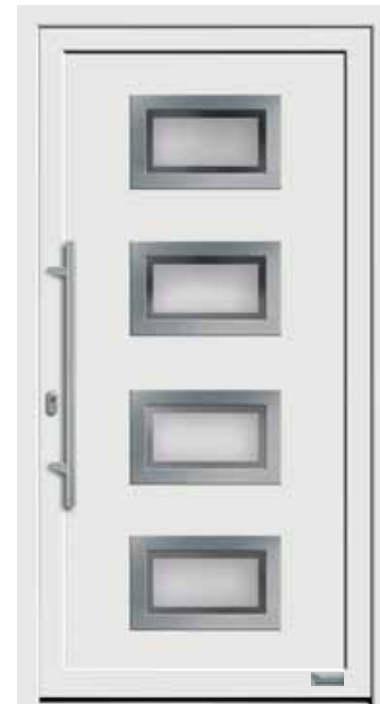
Haustürmodell „7750-70“, mit Griffstange in Edelstahl, Länge: 800 mm, Glas „G500-25“ MP: Orn.-Rahmen Edelstahloptik außen 169,-€