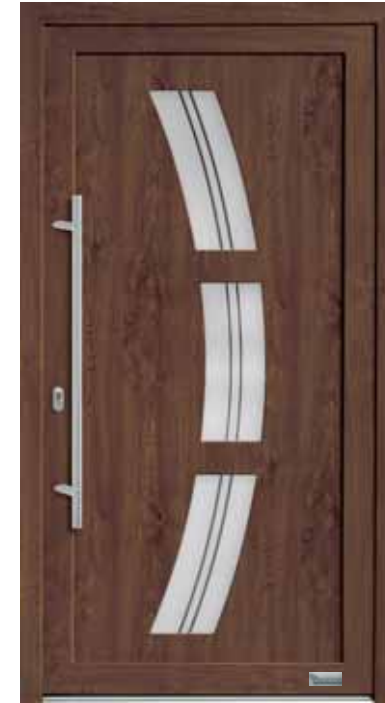
Haustürmodell „7748-50“, mit Griffstange in Edelstahl, Länge: 1000 mm, Glas „G1310“