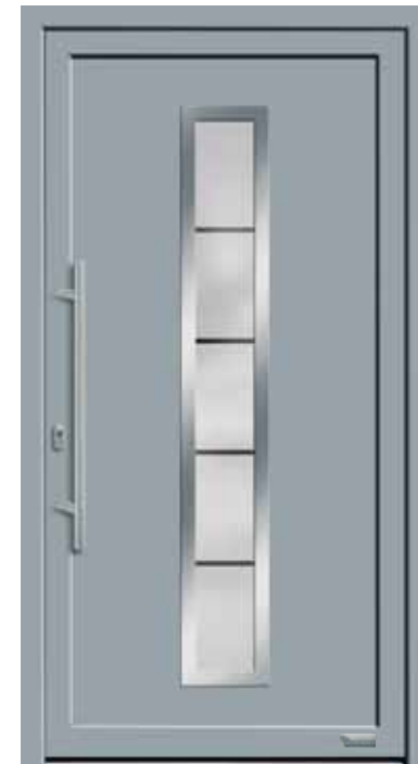
Haustürmodell „7740-70“, mit Griffstange in Edelstahl, Länge: 800 mm, Glas „G1313“ MP: Orn.-Rahmen Edelstahloptik außen 169,-€