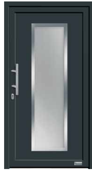
Haustürmodell „7752-70“, mit Griffstange in Edelstahl, Länge: 400 mm, Glas „Satinato“ MP: Orn.-Rahmen Edelstahloptik außen 169,-€