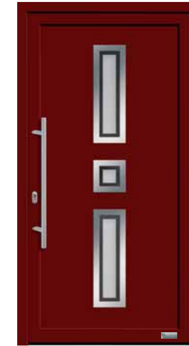
Haustürmodell „7751-70“, mit Griffstange in Edelstahl, Länge: 800 mm, Glas „G500-25“ MP: Orn.-Rahmen Edelstahloptik außen 169,-€