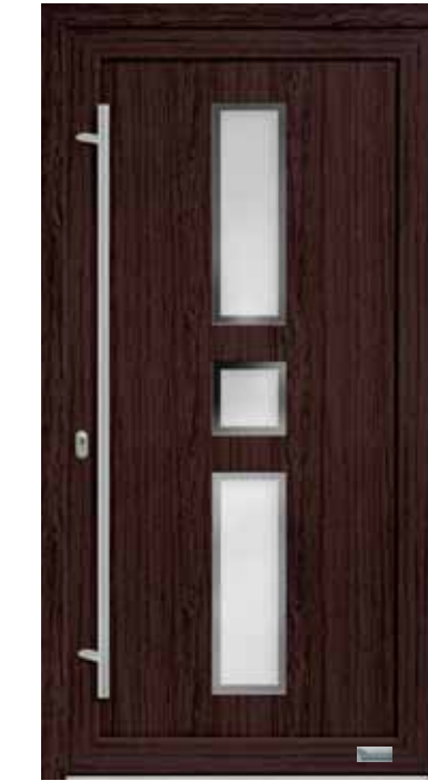
Haustürmodell „7751-50“, mit Griffstange in Edelstahl, Länge: 1600 mm, Glas „G500-25“