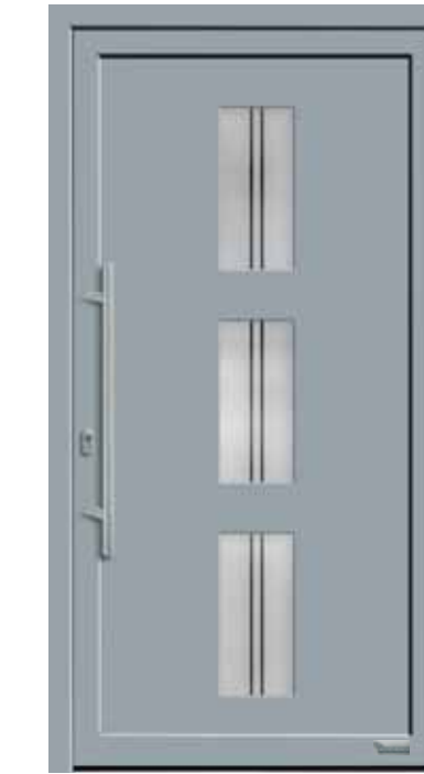
Haustürmodell „7745-50“, mit Griffstange in Edelstahl, Länge: 800 mm, Glas „G1311“