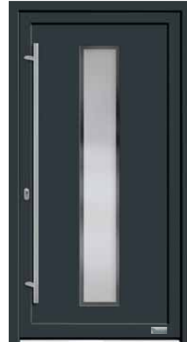
Haustürmodell „7740-50“, mit Griffstange in Edelstahl, Länge: 1600 mm, Glas „G500-25“