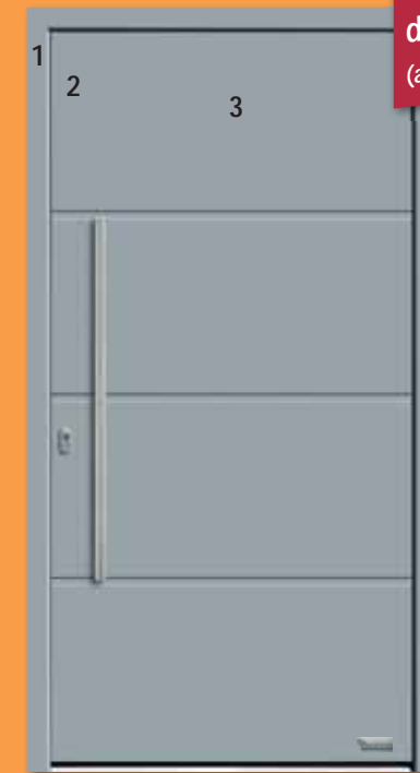
Bild 2) Haustürmodell „7703-92“ mit Aufsatzfüllung 54 mm (flügelüberdeckendes Türblatt gegen Mehrpreis), nur bei nach innen öffnende Haustüren möglich! Außenansicht

1 = Haustürrahmen 2 = Flügel nicht mehr sichtbar 3 = flügelüberdeckende Haustürfüllung