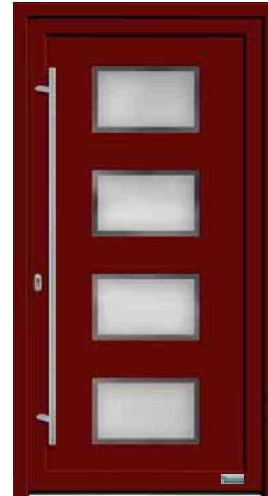
Haustürmodell „7750-50“, mit Griffstange in Edelstahl, Länge: 1600 mm, Glas „G500-25“