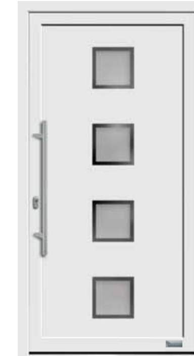
Haustürmodell „7743-50“, mit Griffstange in Edelstahl, Länge: 800 mm, Glas „G500-25“