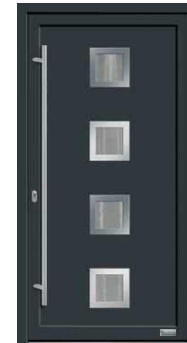
Haustürmodell „7743-70“, mit Griffstange in Edelstahl, Länge: 1600 mm, Glas „Chinchilla“ MP: Orn.-Rahmen Edelstahloptik außen 169,-€