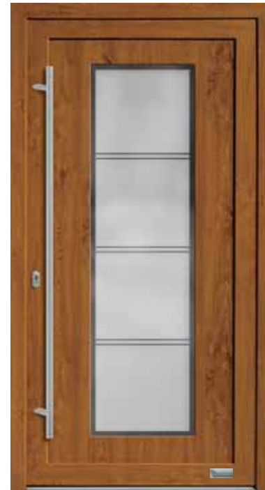
Haustürmodell „7752-50“, mit Griffstange in Edelstahl, Länge: 1600 mm, Glas „G1277“