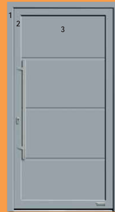
Bild 1) Haustürmodell „7703-92“ mit Einsatzfüllung 36 mm (Standard), Außenansicht

1 = Haustürrahmen 2 = Haustürflügel 3 = Einsatzfüllung