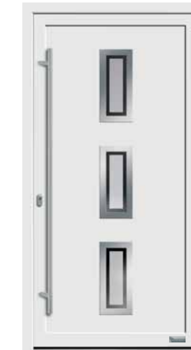
Haustürmodell „7745-70“, mit Griffstange in Edelstahl, Länge: 1600 mm, Glas „G500-25“ MP: Orn.-Rahmen Edelstahloptik außen 169,-€