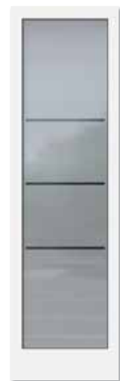
Glasdesign: Mattierung „Halifax“