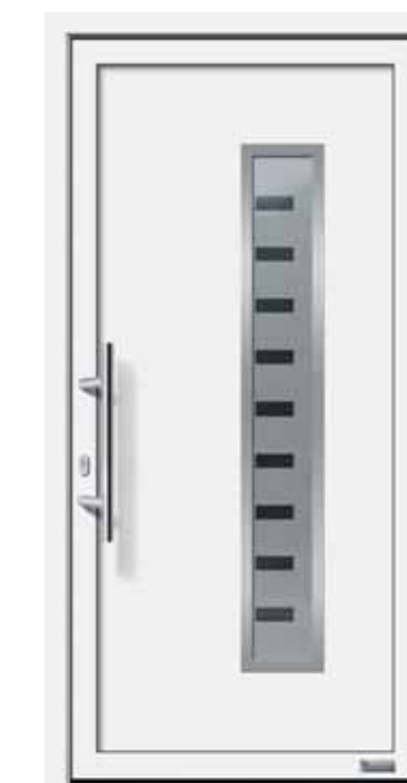
Haustürmodell „Marlo 6E“, mit Edelstahlgriff „Merkur“ 600 mm lang, Glas „Liverpool“