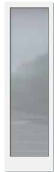
Glasdesign: Mattierung „Bonn“