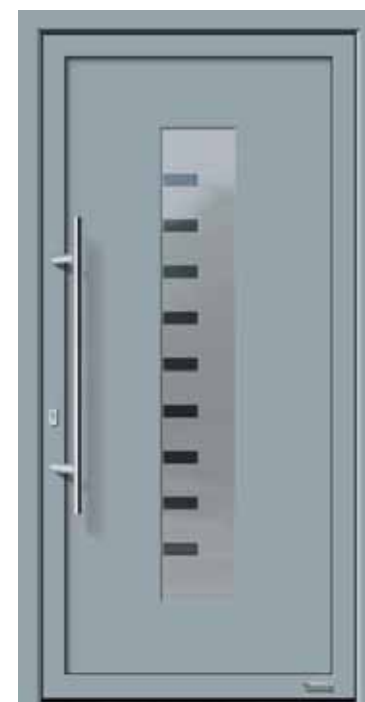
Haustürmodell „Faurus 2“, mit Edelstahlgriff „Merkur“ 1000 mm lang, Glas „Liverpool“