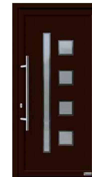
Haustürmodell „Balar 2“, mit Edelstahlgriff „Merkur“ 1000 mm lang, Glas „Berlin“