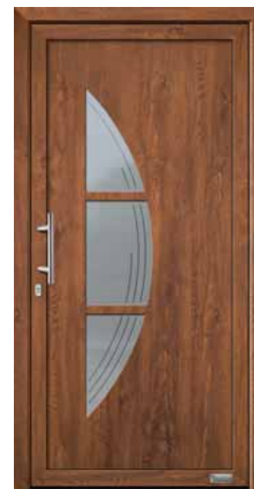
Haustürmodell „Juno 4“, mit Edelstahlgriff „Maike“ 330 mm lang, Glas „Equador“