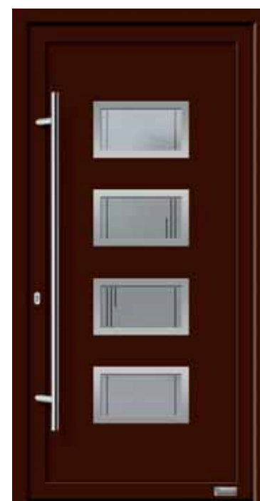
Haustürmodell „Laguna 6E“, mit Edelstahlgriff „Merkur“ 1600 mm lang, Glas „Lindos“