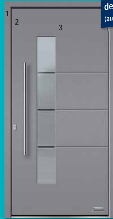
Bild 2) Haustürmodell „Robin2“, Glas Halifax flügelabdeckendes Türblatt (Mehrpreis) Außenansicht

1 = Haustürrahmen 2 = Flügel nicht mehr sichtbar 3 = flügelabdeckende Haustürfüllung