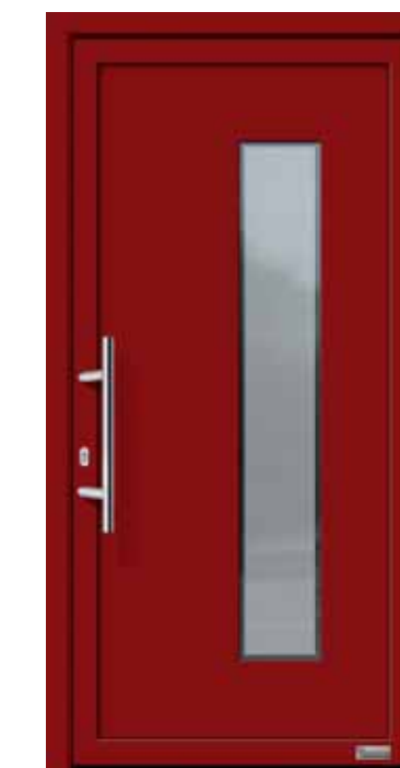
Haustürmodell „Marlo 2“, mit Edelstahlgriff „Merkur“ 600 mm lang, Glas „Berlin“