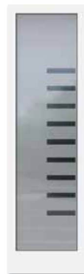
Glasdesign: Mattierung „Liverpool“

Preise für Seitenteil inklusive Statikprofil bei Kunststoff-Haustüren Wärmeschutzglas U_g = 1,1 \text{ W/m}^2\text{K} mit warmer Kante, inkl. 1x VSG 6 mm, wahlweise kombiniert mit Klarglas, Chinchilla weiß, Mastercarre weiß, Uadi weiß, Mattierung „Bonn“ (vollflächig mattiert), „Berlin“, „Baku“, „Halifax“, „Liverpool“