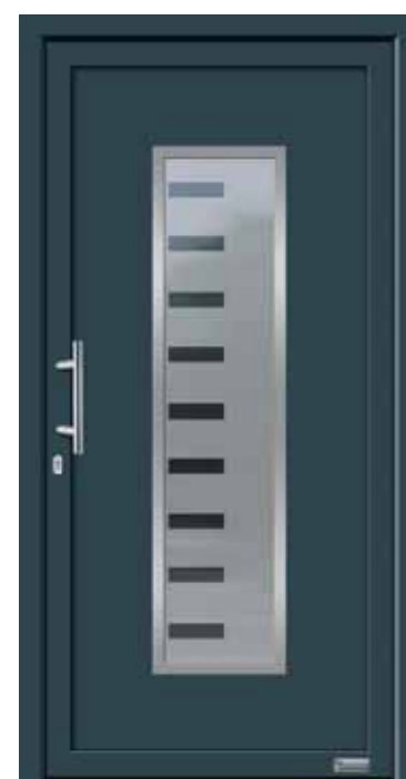
Haustürmodell „Argo 6E“, mit Edelstahlgriff „Maike“ 330 mm lang, Glas „Liverpool“

Wegen der Ziernuten nur in Alu-RAL, oder in Kunststoff weiß lieferbar !