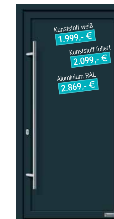
Haustürmodell „Basic“ mit Edelstahlgriff „Merkur“ 1600 mm lang