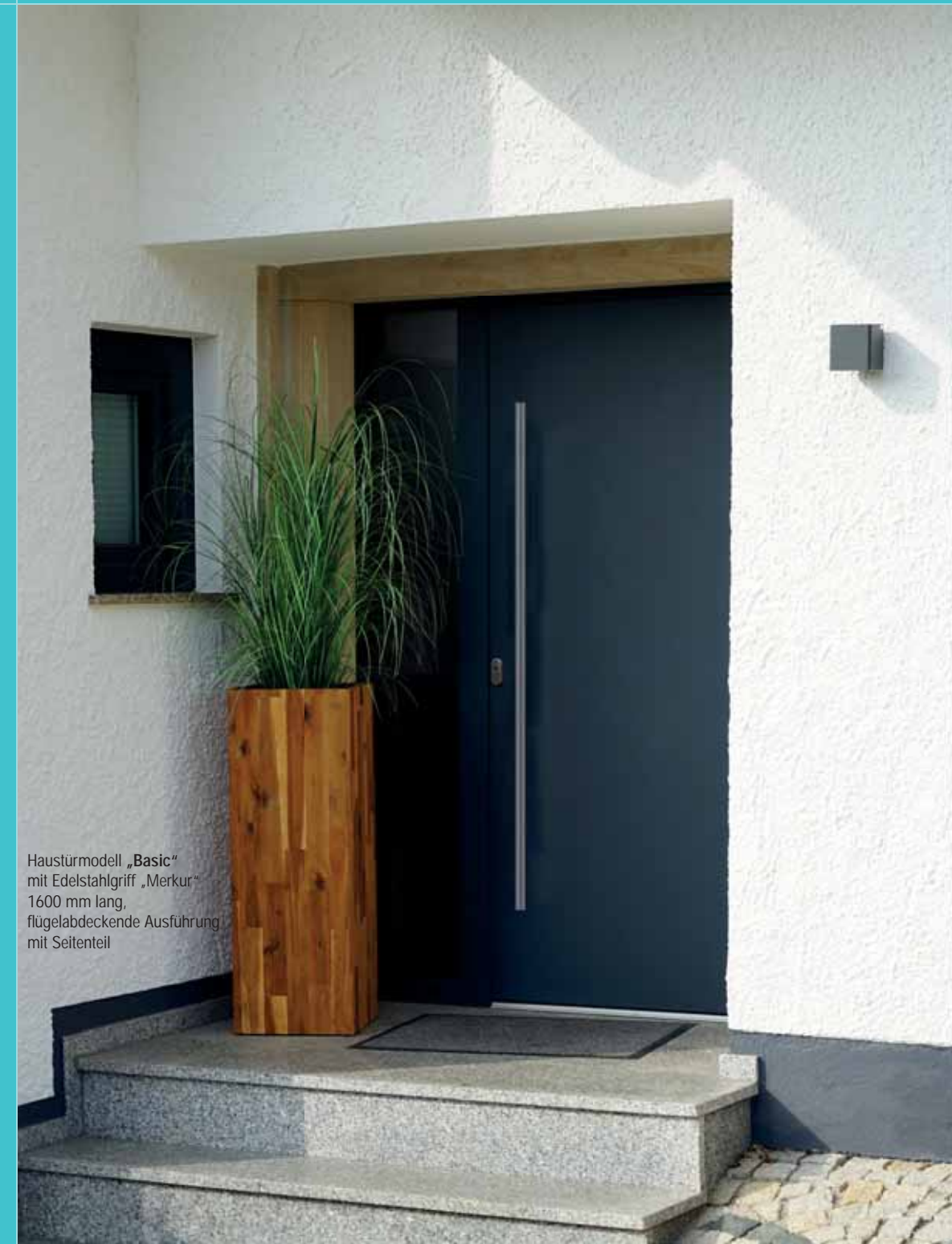
Haustürmodell „Basic“ mit Edelstahlgriff „Merkur“ 1600 mm lang, flügelabdeckende Ausführung mit Seitenteil

HAUSTÜREN AUS ALUMINIUM ODER KUNSTSTOFF - sicher wärme gedämmt - zeitloses Design