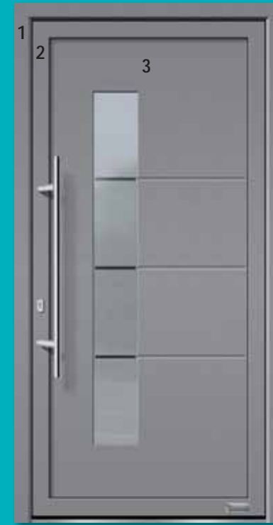
Bild 1) Haustürmodell „Robin2“, Glas Halifax mit Einsatzfüllung (Standard) Außenansicht

1 = Haustürrahmen 2 = Haustürflügel 3 = Einsatzfüllung