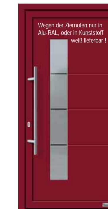
Haustürmodell „Robin 2“, mit Edelstahlgriff „Merkur“ 1000 mm lang, Glas „Halifax“

Wegen der Ziernuten nur in Alu-RAL, oder in Kunststoff weiß lieferbar !