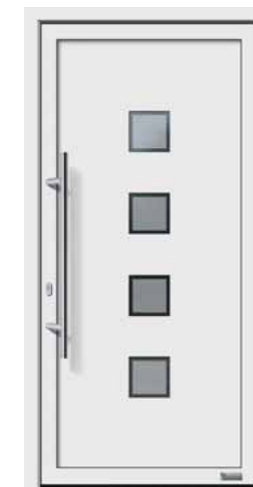
Haustürmodell „Lenwe 2“, mit Edelstahlgriff „Merkur“ 1000 mm lang, Glas „Berlin“