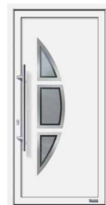
Haustürmodell „Juno 6E“, mit Edelstahlgriff „Merkur“ 1000 mm lang, Glas „Berlin“