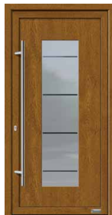
Haustürmodell „Argo 2“, mit Edelstahlgriff „Merkur“ 1600 mm lang, Glas „Baku“