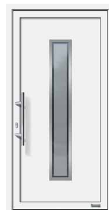
Haustürmodell „Faurus 6E“, mit Edelstahlgriff „Merkur“ 600 mm lang, Glas „Berlin“