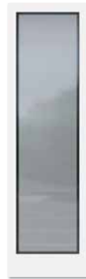
Glasdesign: Mattierung „Berlin“