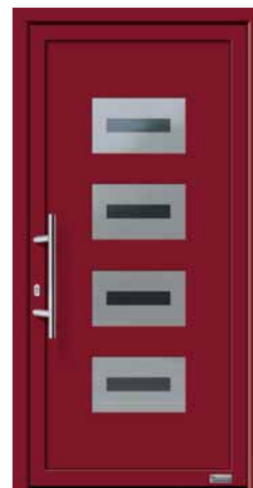
Haustürmodell „Laguna 2“, mit Edelstahlgriff „Merkur“ 600 mm lang, Glas „Havana“