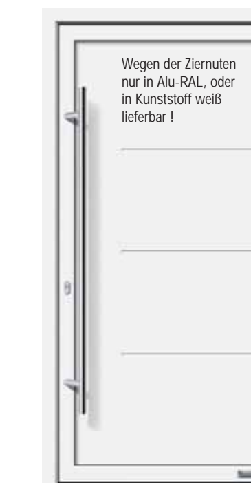
Haustürmodell „Camillo“, mit Edelstahlgriff „Merkur“ 1600 mm lang

Wegen der Ziernuten nur in Alu-RAL, oder in Kunststoff weiß lieferbar !